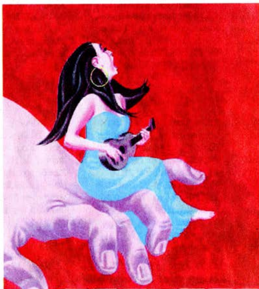
Teresa Larraga voguera sur les notes de la musique espagnole des 19e et 20e siècles. NOÿAU

Pivot de ce spectacle conçu par Teresa Larraga, la musique s'agrippe néanmoins à un mince fil dramaturgique: nous voici dans un musée laissé à l'abandon, un lieu de mémoire où sommeillent des partitions, des instruments de musique, des objets aussi élémentaires qu'une chaise ou qu'une lampe... Dans cet univers contemporain mais légèrement décalé, deux personnages – ils restent indéfinis – ractent, se transforment, font leur miel